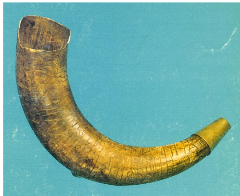
Byhornet fra Drejø. Årstallet 1444 er måske en spøg – måske ikke?