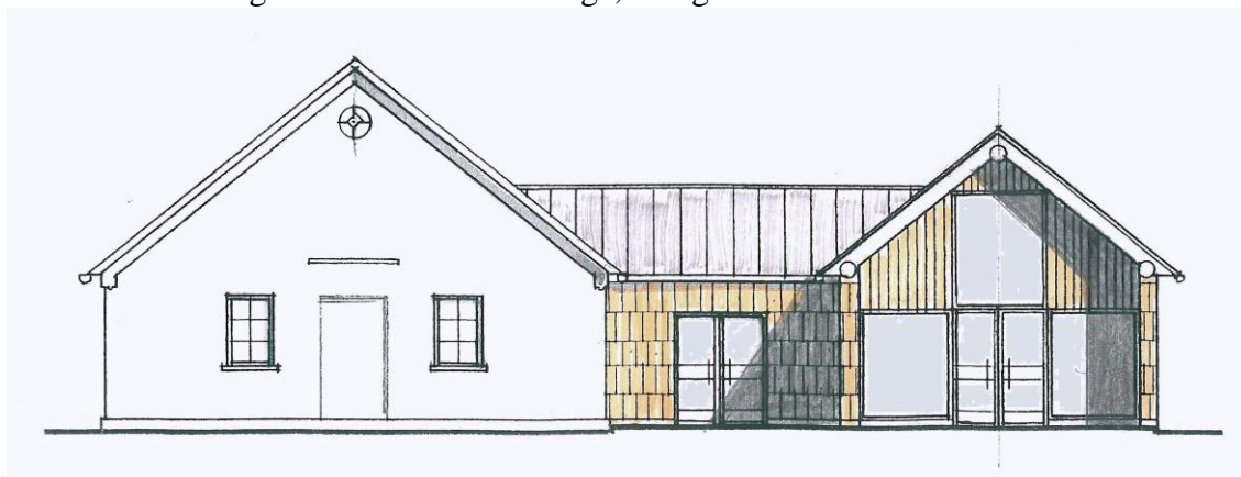
Facade af lærkespån – og solceller på taget – lavenergihus.

Huset bliver stadig godt brugt, også af mange uden for øen. – Det er Øens vigtigste samlingssted – Øens sociale center – og det skal værnes i mange, mange år endnu.